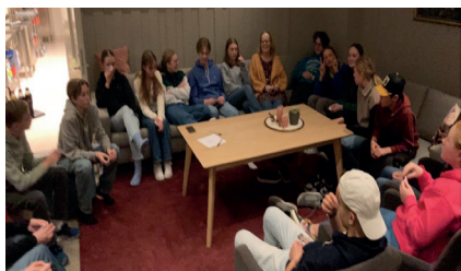
Felleslek for de som vil - på ÅpentHus (4 mann i sofaen)

KRIK kan være i hallen eller et sted ute. Da starter vi med aktiviteter 18.30-20.30, i løpet av de to timene blir det holdt en liten andakt som varer i noen få minutter. Etter aktivitetene er det taco på Huset kl. 21.00 med noe digg til dessert. Der er det også mulighet for å spille og være sammen ut over kvelden.