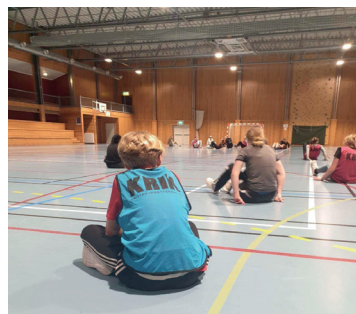
Rompefotball på KRIK

FØLG MED PÅ INSTAGRAM ELLER LEGG OSS TIL PÅ SNAPCHAT, der vil det komme informasjon og mer detaljer rundt hver kveld :)