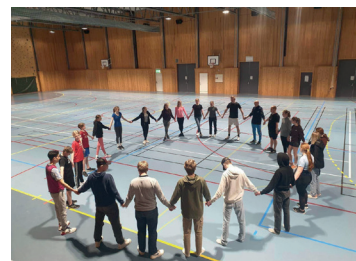
Felles avslutning på KRIK med Fader vår