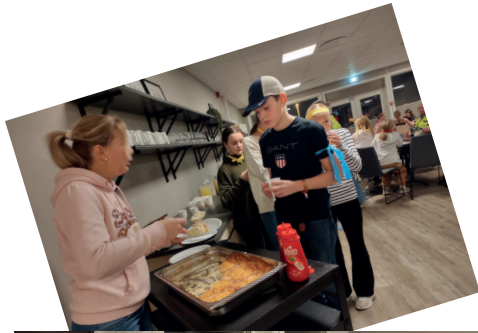
Tekst og foto: Kari Garthus