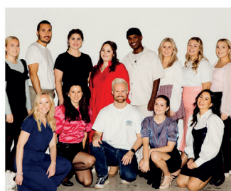
NEW VOICES JULEKONSERT

Jeg har jo søgt deg: Vær modig og stærk! Lad dig ikke skræmme, og mist ikke modet! For færræn din Gud er med dig overalt hvor du går. Jes 1,9